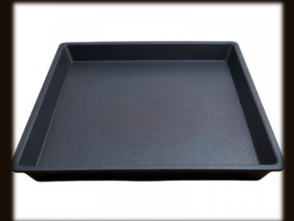
Schale eckig 26x26 cm