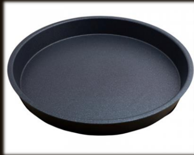
Snackschale ø 24 cm