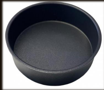
Snackschale ø 19 cm